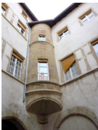
Des ruelles médiévales aux cours mystérieuses