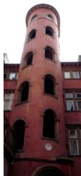
La tour rose dans le Vieux-Lyon