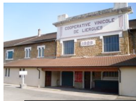
Cave coopérative du Beaujolais

Sur la route du vin : venez découvrir les crus du Beaujolais. Rencontres privilégiées avec des producteurs et dégustation au programme!