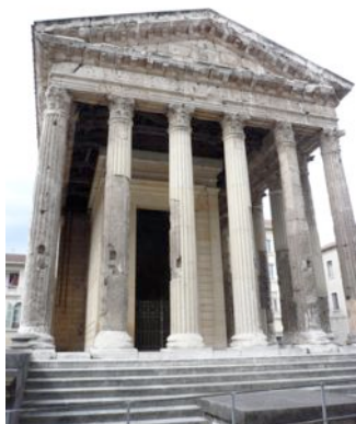
Le temple d'Auguste et Livie, réplique de la Maison carrée de Nîmes.

Remontez le temps à travers ses vestiges de l'Empire romain au Moyen-Age :