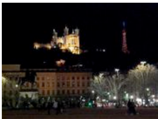
Lyon depuis la place Bellecour

Déjà sous Jules César, la ville était choisie pour installer une colonie romaine puis devenir capitale des Gaules grâce à sa position stratégique.