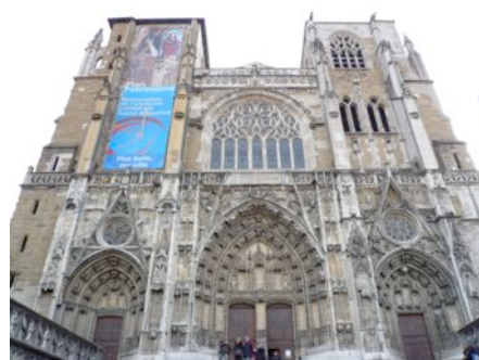
La cathédrale Saint-Maurice (XIIe-XVIe s.)