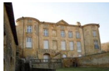
Château de Rochebonne - Theizé

Le Beaujolais des Pierres Dorées est composé d'une quarantaine de villages. Le fer contenu dans la terre de cette région provoque la couleur ocre de la roche. Pour cette raison on l'appelle souvent "la petite Toscane". Nous vous proposons un tour guidé dans les villages les plus caractéristiques.