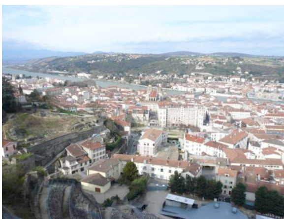
Vue panoramique de la ville et ses vestiges gallo-romains

Sans oublier le musée des Beaux-arts et d'Archéologie et celui de Saint-Romain en Gal pour vous faire partager les trésors mis à jour grâce aux fouilles archéologiques !