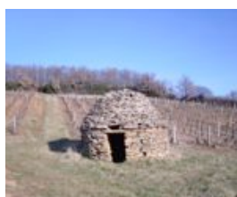
Une cadole dans le vignoble