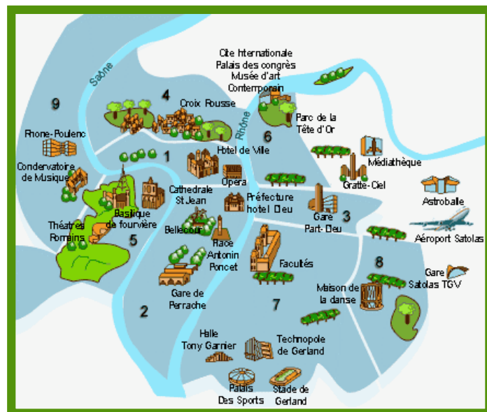
Plan de Lyon