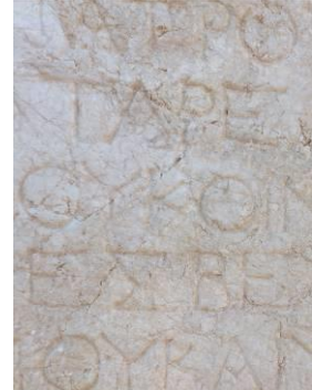
Ruine des assemblées de Patara