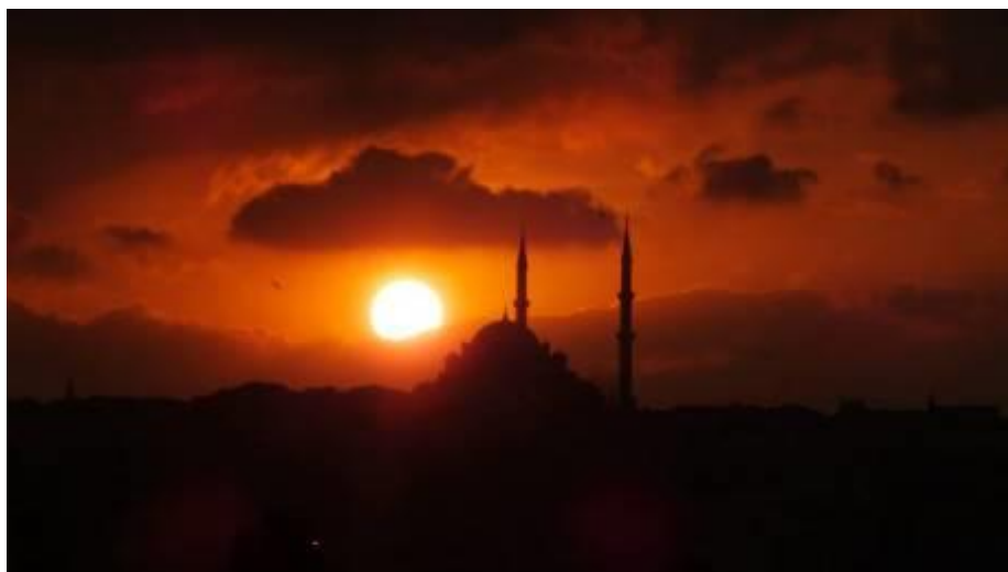
Mosquée neuve ou mosquée nouvelle d'Istanbul (le nom est trompeur, la mosquée a été inaugurée en 1665).