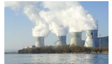
Cruas et Creys Malville

>Cruas (07)- EDF propose autour de ce site un circuit « bas-carbone » combinant une conférence et visite autour du nucléaire et de la centrale de Cruas et une découverte du Parc éolien.