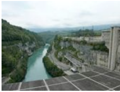
Barrage de Génissiat