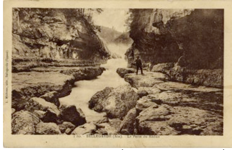
Pertes du Rhône- Carte postale ancienne.