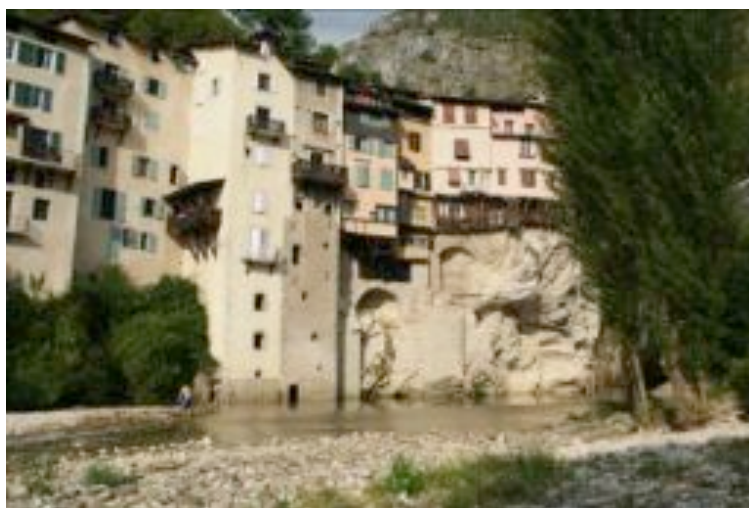
Idée de sortie : le village de Pont en Royans et ses maisons suspendues au dessus de la rivière de la Bourne.