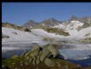
Lac de la Belle Etoile Massif de Belledonne